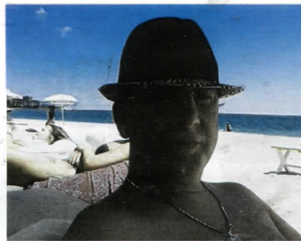
Да ли и овдје промовише СДС - Шура на атрактивној туристичкој дестинацији

У вријеме када је на хиљаде грађана Теслића без посла "Питњаци" мијењају