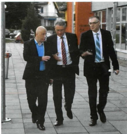
Од њих се може очекивати само катастрофа

Мишљења смо да потпуну одговорност за све што се десило приликом пописа 2013.