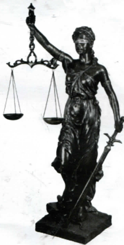
Хоће ли их стићи правда?

бесплатно паркирање, општини дали фотокопије своје личне карте. СДСови општинари су једноставно те податке преписали на образац који се доставља у Централну изборну комисију, па испаде да су грађани без своје воље подржали кандидатуру ове три партије на локалним изборима у Теслићу. Ко је то урадио у општини Теслић требали би утврдити истражни органи, ако у овој држави уопште постоје истражни органи, осим наравно на платном списку. Ми овај пут прозивамо Јавно тужилаштво и МУП Републике српске и пријављујемо кривично дјело Злоупотребе службеног положаја или овлашћења из члана 347 Кривичног закона Републике Српске. Ко је у општини злоупотребио свој службени положај и спискове грађана за бесплатно паркирање преписао као спискове