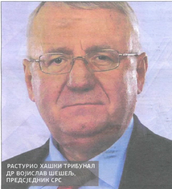
РАСТУРИО ХАШКИ ТРИБУНАЛ ДР ВОЈИСЛАВ ШЕШЕЉ, ПРЕДСЈЕДНИК СРС