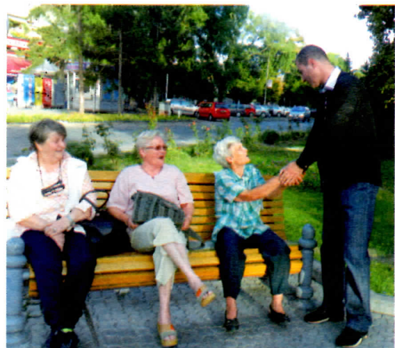
Брига о најстаријима