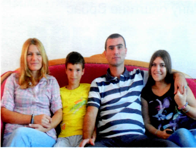
Породица као ослонац и подршка