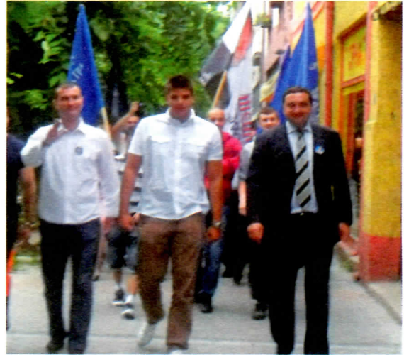
Српски радикали-једини избор