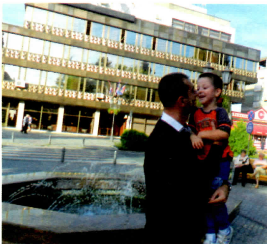
Будућност општине Врбас