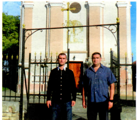
Поштовање вере и традиције