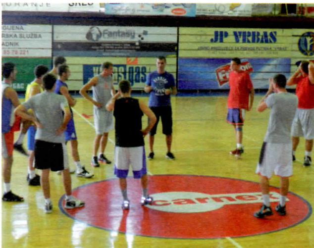
Спортиста, данас тренер кошаркаша