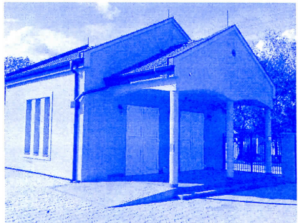
ВИШЕ МИЛИОНА ЗА ЗАВРШЕТАК КАПЕЛЕ