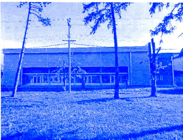
МИЛИОН ЗА СПОРТСКУ ХАЛУ