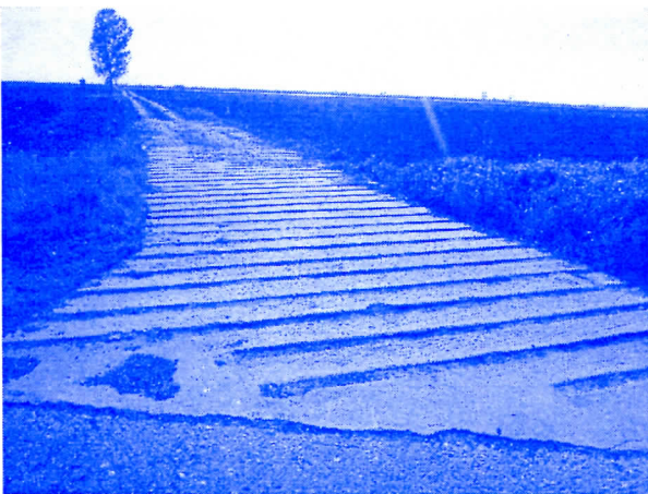
АТАРСКИ ПУТЕВИ И ОТРЕСИШТА