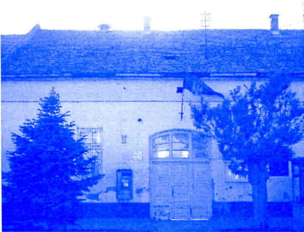
700 ХИЉАДА ЗА ЗГРАДУ МЗ