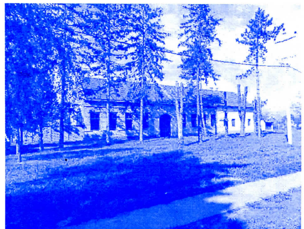
650 ХИЉАДА ЗА ПРОЈЕКАТ НОВОГ ОБЈЕКТА