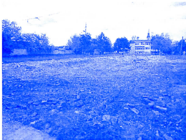
ДО КРАЈА МЕСЕЦА ТЕМЕЉИ СПОРТСКЕ ХАЛЕ