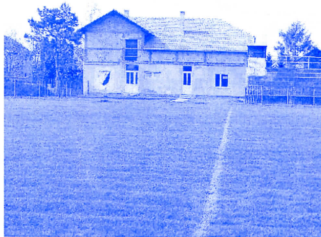
ДРАГОЦЕНА ПОМОЋ ФУДБАЛСКОМ КЛУБУ