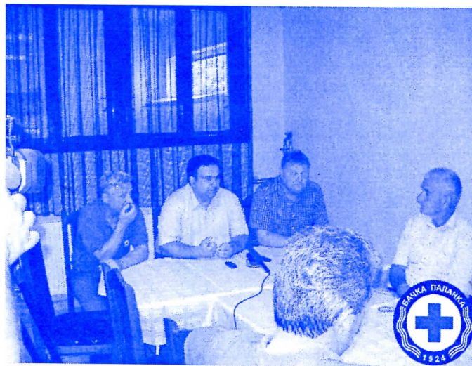
САРАДЊА СА НАЈХУМАНИЈИМА