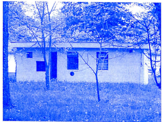
РЕШАВАЊЕ КОМУНАЛНИХ ПРОБЛЕМА