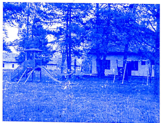
БРИГА О НАЈМЛАЂИМА