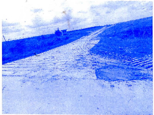
УЛАГАЊЕ У АТАРСКЕ ПУТЕВЕ И ОТПРЕСИШТА