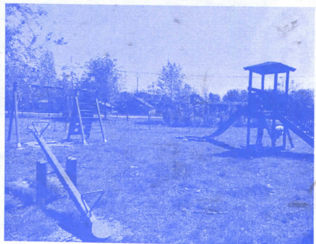
БРИГА О НАЈМЛАЂИМА