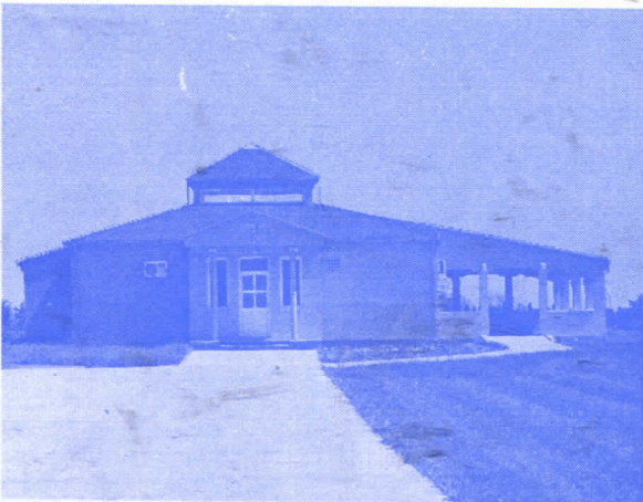
КАПЕЛА СА ПАРКИНГ ПРОСТОРОМ