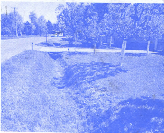
ПРОКОПАНИ КАНАЛИ У СВЕТОСАВСКОЈ