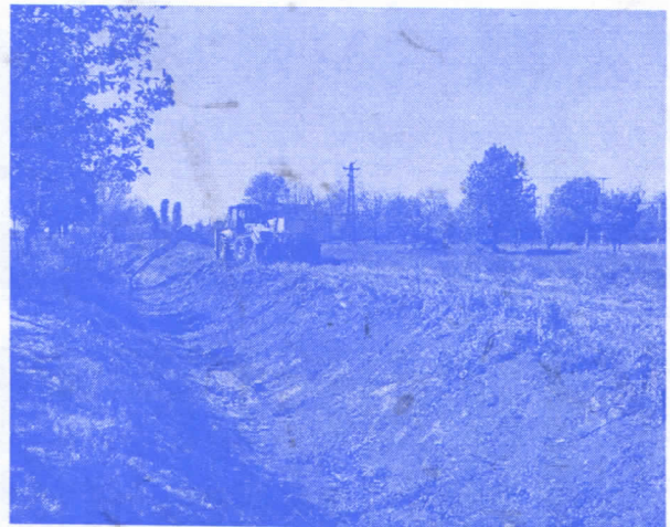
ПРОКОПАВА СЕ КАНАЛ КРОЗ СЕЛО