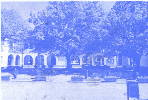
НОВИ КРОВ НА ДОМУ КУЛТУРЕ