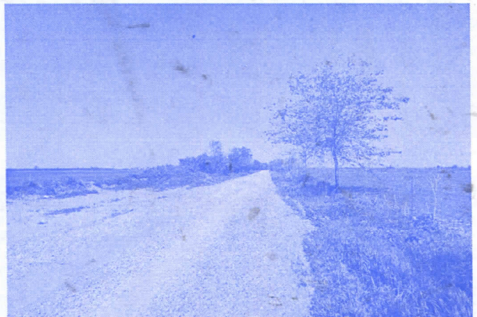
АТАРСКИ ПУТ ПРЕМА ПАРАГАМА