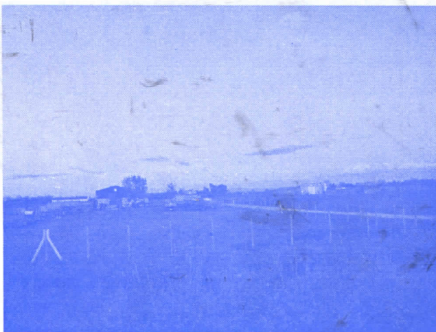
ДОЗВОЛЕ ЗА НОВУ ФАБРИКУ