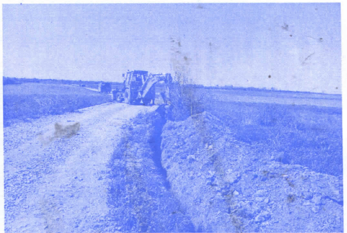
СПАЈАЊЕ КАНАЛИЗАЦИЈЕ СА ПРЕЧИСТАЧЕМ