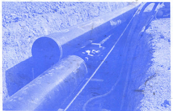
ГАСНА МРЕЖА КРОЗ СЕЛО