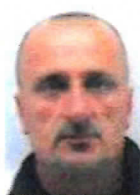
Драгиша Тодорчевић теолог