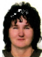
Мира Шуђур гимназија