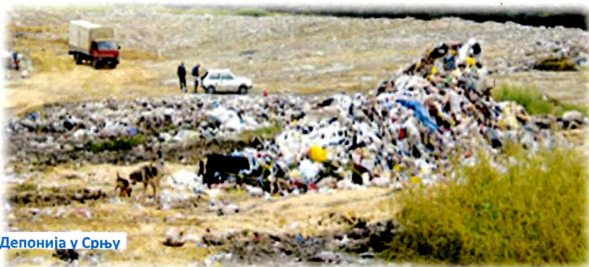
Депонија у Срњу

Можемо често чути, од политичких неистомишљеника, разне приче о унапређењу и заштити животне средине. Све те приче су само „мртво слово на папиру“. „Рак рана“ на територији града Крушевца је депонија у Срњу која представља праву еколошку бомбу, како за наш град, тако и за ширу околину. Нико од надлежних није понудио адекватно решење за санирање овог проблема, а невоље се само продубљују, и из дана у дан убрзавају се хемијски процеси који угрожавају здравље људи и на широј територији града. Како треба решити проблем депоније у Срњу? Први