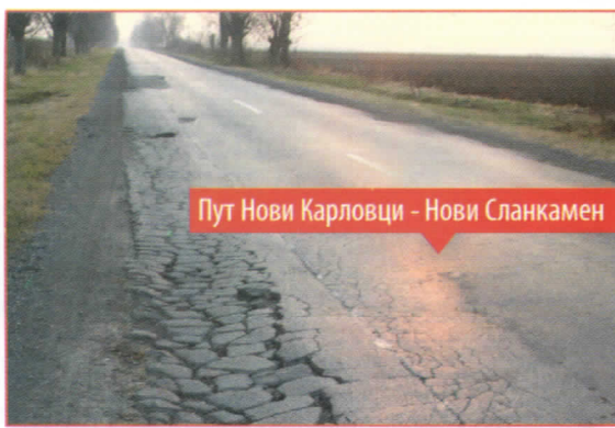
Пут Нови Карловци - Нови Сланкамен