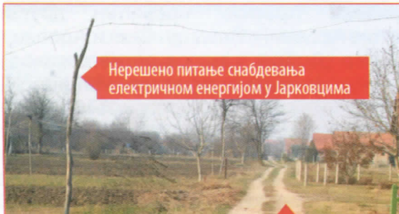
Нерешено питање снабдевања електричном енергијом у Јарковцима