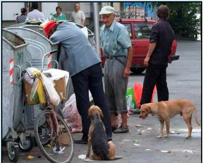
ТУЖНА ИСТИНА: док власт расипа паре на музику народ јој се храни из контејнера

Не дати својој гладној деци, не дати гладној деци својих комшија, а дати једном музичару, једном продавцу магле из Сарајева, чије се богатство мери милионима евра.