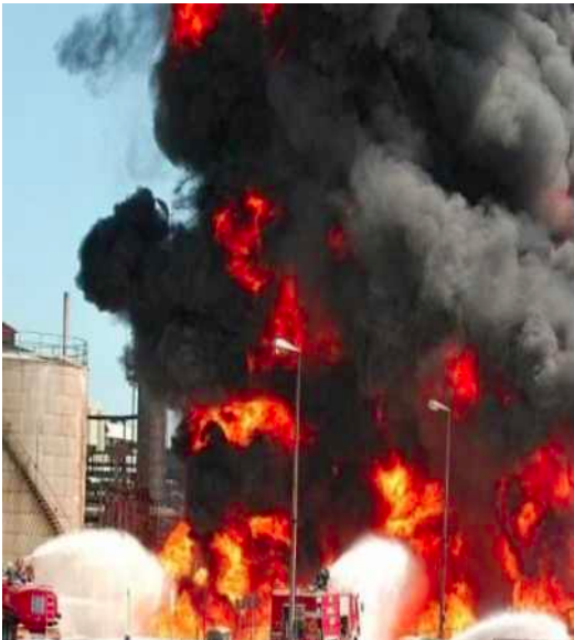
Еколошка бомба: пожар у рафинерији

Позивамо све грађане Смедерева, посебно чланове и симпатизере СРС, да присуствују трибини.