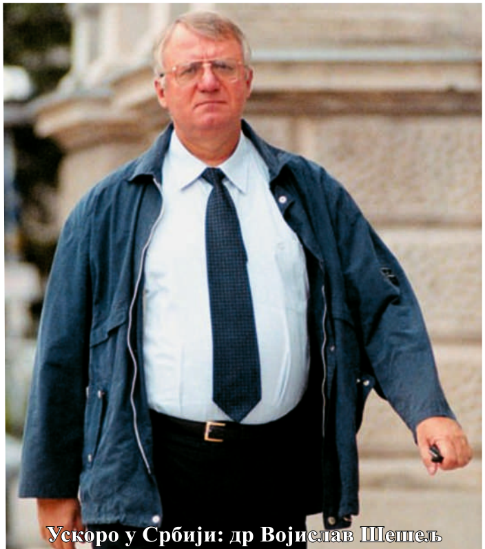
Ускоро у Србији: др Војислав Шешељ

Зато што једино функционера СРС нема у великим финансијским аферама које свакодневно потресају Србију, а у којима је ова земља опљачкана за милијарде евра.