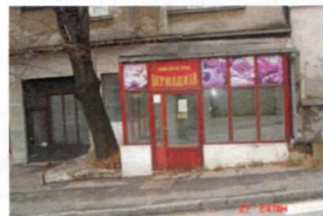
Грчића Миленка 14а

Покретни објекат-киоск на углу улица Бирчанинове и Булевар ослобођења није у власништву ГО Врачар, тј. није поверен на управљање ЈП „Пословни простор Врачар“. Пословне просторије у улици Булевар ослобођења 31 исељене су од стране „ХИДРОТЕХНИКА-БЕОГРАДГРАДЊА“ 06.10.1999. године по Закључку о дану и часу исељења, посл.бр. И-210/97, Четвртог општинског суда у Београду.