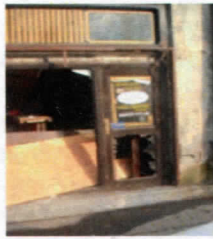
Булевар ослобођења 31