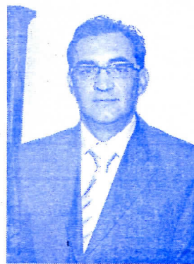
Члан Централне отаџбинске управе