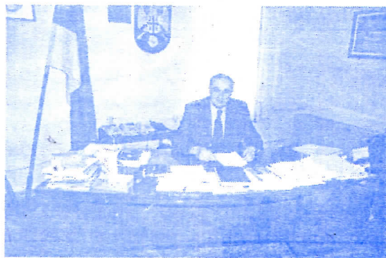
Члан Председничког колегијума