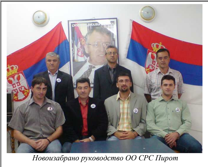
Новоизабрано руководство ОО СРС Пирот