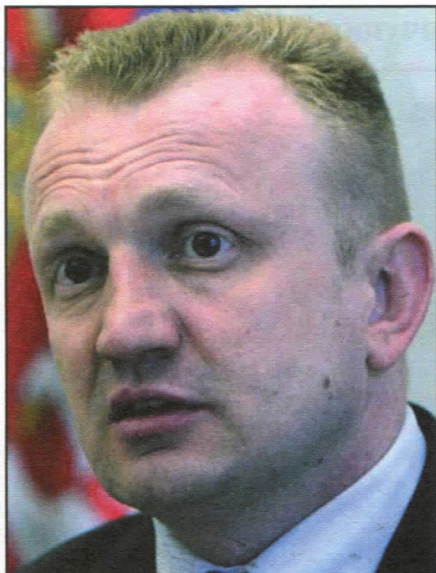
Чије интересе штити Ђилас?

Уколико се то пак догоди, потребно је да се, у одговору на захтев, позове на застарелост захтева за испуњење обавеза.