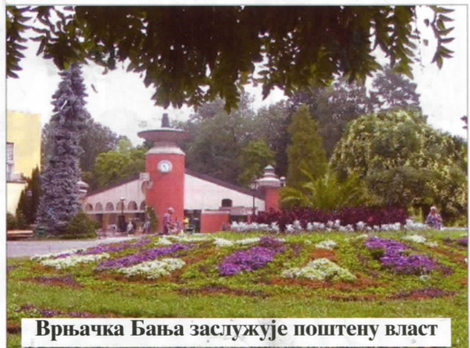
Врњачка Бања заслужује поштену власт

Ипак, за Николића и његову групу је тај штетни споразум са ЕУ био разлог за отпочињање јавних сукоба у оквиру Српске радикалне странке и нападе на човека који је већ 6 година у хашком казамату, др Војислава Шешеља.