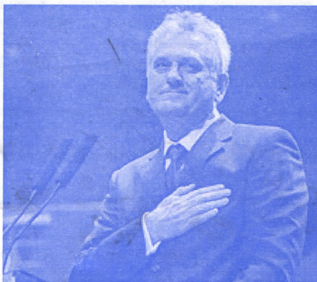
Свим срцем за Бориса Тадића