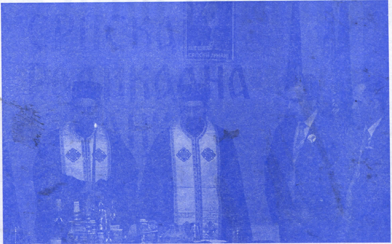
Обележена крсна слава Св Три Јерерха у просторијама странке