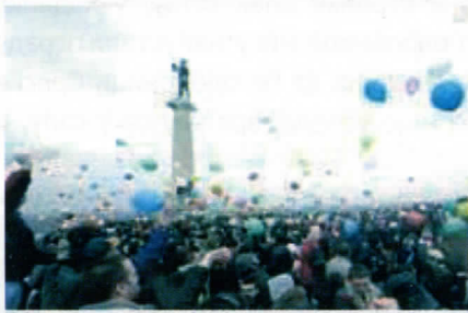
Пристилице ДС прослављају смрт Слободана Милошевића

Сада им не смета да са том истом Социјалистичком партијом Србије формирају већину и на Општини Вождовац.