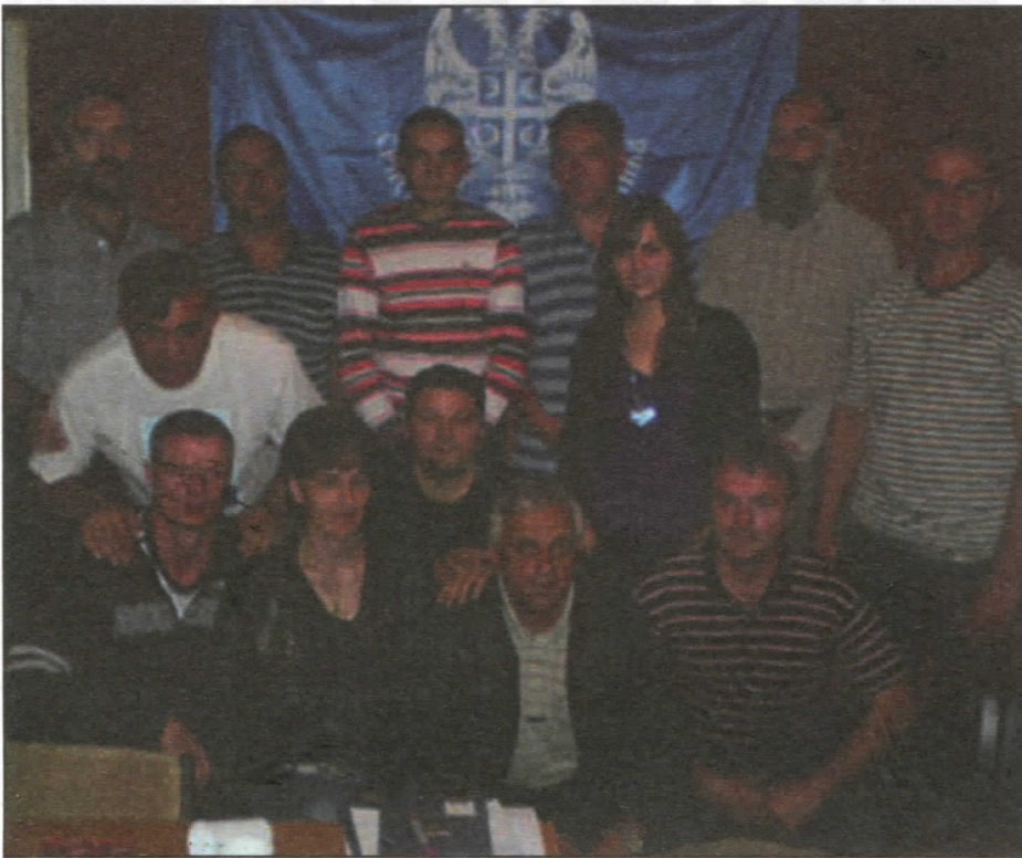
ДИО ЧЛАНОВА ОПШТИНСКОГ ОДБОРА СРПСКЕ РАДИКАЛНЕ СТРАНКЕ ДР ВОЈИСЛАВ ШЕШЕЉ У КНЕЖЕВУ

која никада није ни размишљала о томе да помогне младима у потрази за послом и свим осталим грађанима, у зависности којој категорији припадају (пензионери, породице погинулих бораца, ратни војни инвалиди, социјално угрожене категорије).