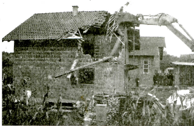
Противправно рушење српске куће у Которском

Затим, наши посматрачи су извјестили о томе да је у Кожухама и још неким бирачким мјестима на Требави на крају, по затварању бирачког мјеста, вршено попуњавање и убацивање великог броја листића у гласачке кутије на основу бирача који нису изишли на биралишта. Гласови су тако давани СДС-овом кандидату за начелника и одборничком кандидату с тог терена. Највише наших жалби се односи на овакву нерегуларност.