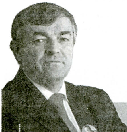
Генерал Божидар Делић