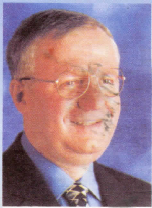
ДР. ВОЈИСЛАВ ШЕШЕЉ ПОБЕДНИКУ ХАШКИ ТРИБУНАЛ

СТАРА ПАЗОВА, МАЈ 2008 ГОДИНЕ ГОДИНА XIX БРОЈ: 3193