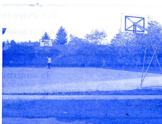
нови спортски терени