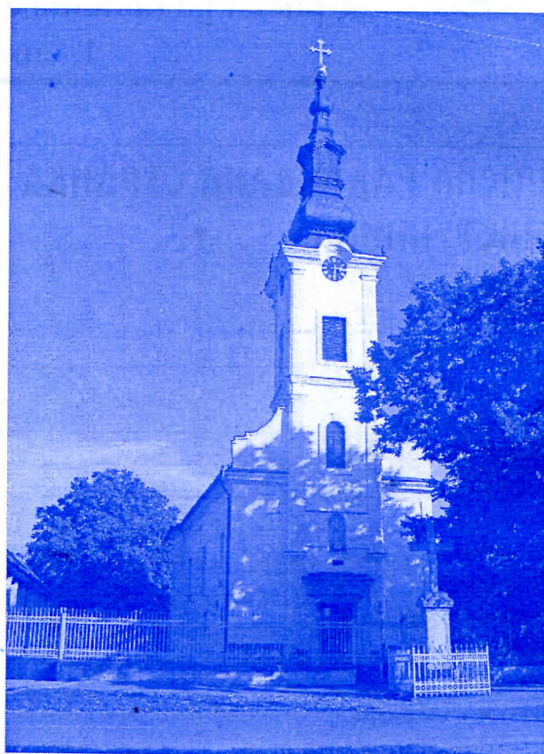
помоћ традиционалним црквама