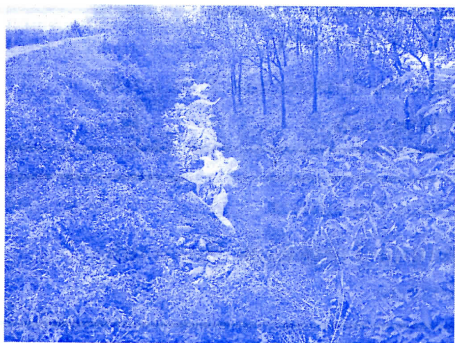
решићемо канал иза цркве