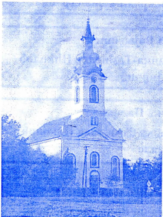
помоћ Евангелистичкој цркви