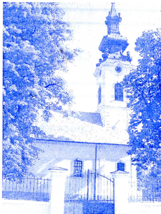
реновирана Српска Православна црква