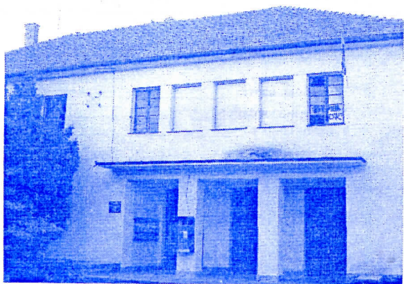
Дом културе(реновирана библиотека)