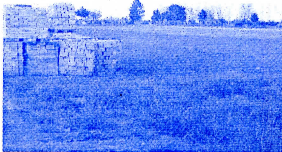
почиње изградња капеле