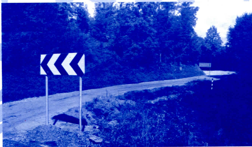
Регионални путни правац Крупањ - Столице - Лозница

Регионални путни правци Крупањ - Лозница, преко Столица и Крупањ - Шабац, преко Завлаке само што нису пресечени клизиштима. Тако стоји годинама. Започети радови на путу Крупањ - Љубовија су у застоју, чекају нове изборе да још једном преваре грађане Рађевине.