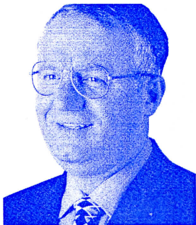
Др Војислав Шешељ

Председник Српске радикалне странке др Војислав Шешељ подржао одборничку листу Српска радикална странка – Томислав Николић за локалне изборе 11. маја 2008. године у општини Чајетина