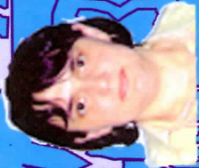
Рузык Бошан 1977, синабар Алгана