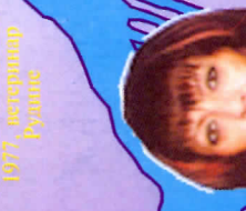
Рузык Бошан 1977, синабар Алгана