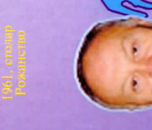
Рузык Бошан 1977, синабар Алгана