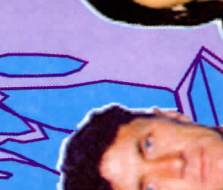
Рузык Бошан 1977, синабар Алгана