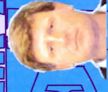
Рузык Бошан 1977, синабар Алгана