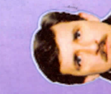
Рузык Бошан 1977, синабар Алгана