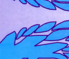
Рузык Бошан 1977, синабар Алгана