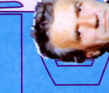
Рузык Бошан 1977, синабар Алгана