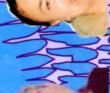
Рузык Бошан 1977, синабар Алгана