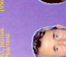
Рузык Бошан 1977, синабар Алгана