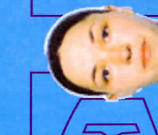
Рузык Бошан 1977, синабар Алгана