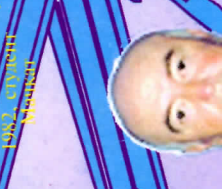
Рузык Бошан 1977, синабар Алгана