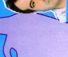
Рузык Бошан 1977, синабар Алгана