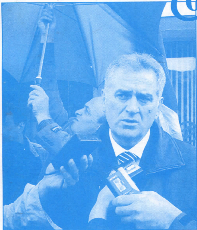
Влада Српске радикалне странке биће народна влада

Као озбиљна и одговорна странка пред вас износимо програм који ћемо сигурно испунити и који је у складу са надлежностима јединице локалне самоуправе предвиђеним Законом о локалној самоуправи.