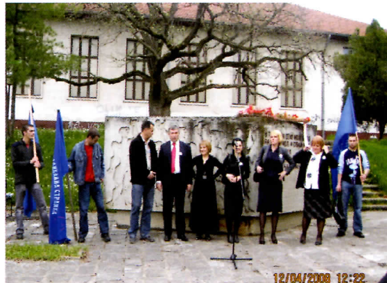
Челници СРС у посети Рачи

Трудићемо се да се фабрика у наредној години заврши и започећемо реконструкцију водоводне мреже, која је у лошем стању. Српска радикална странка због ситуације у Комуналном предузећу залагаће се за издвајање Водовода од Комуналног предузећа, или за озбиљнију реконструкцију ЈКП-а.