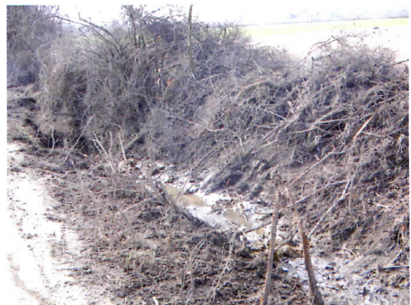
Наша власт чисти канале поред главног пута у селу Трска

Уређење градског гробља треба да буде трајно решено на начин који ће обезбедити уредно и редовно одржавање гробља. У сеоским срединама задужићемо месне заједнице да воде рачуна о уређењу сеоских гробља.