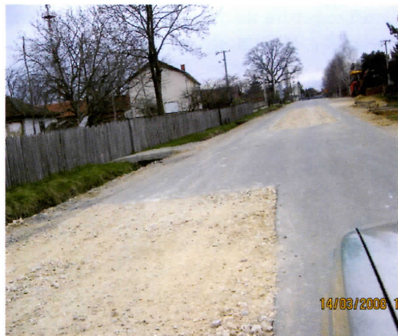
Пут у Вучићу, којем је само после 2 месеца од асвалтирања било потребно крпљење.

Гасовод је озбиљна инвестиција која је значајна за нашу општину. С обзиром на то да гасовод који иде из Русије-Бугарске-Србије према делу Европске уније, (један крак ће ићи према Босни и Хрватској) који може проћи и кроз нашу општину, инсистираћемо да постигнемо са свим странкама консензус о стратешкој важности тог пројекта.