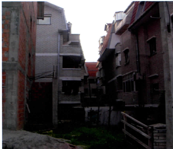
Жарково као синоним за нелегалну градњу

Као свој велики плус, Демократска странка наводи и наставак изградње станова и насеља уз строго поштовање законских прописа. А пример тога како Демократска странка „строго поштује законске прописе у изградњи станова и насеља“ је градња у Жаркову, које сада подсећа на „стовариште“ кућа, а код комшије на кафу можете доћи преко прозора.