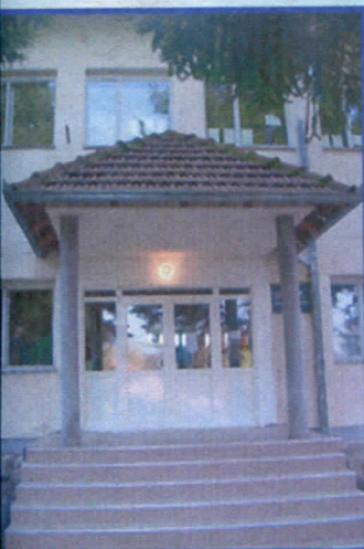
ШКОЛА ВЕЉА ГЕРАСИМОВИЋ

Посебна нажња прилаже се уређивању спортских терена, па је у Основној Школи «Веља Герасимовић» у Венчанима асфалтирано и осветљено школско игралиште, док је планирано 10 милиона динара за Балон-салу основној школи «Милош Обреновић». Уз ово треба додати и рађен терен на Ђикином брду, као и терене у насељу у улици Раће Југовић, за чије уређење је издвојено 4 милиона динара.