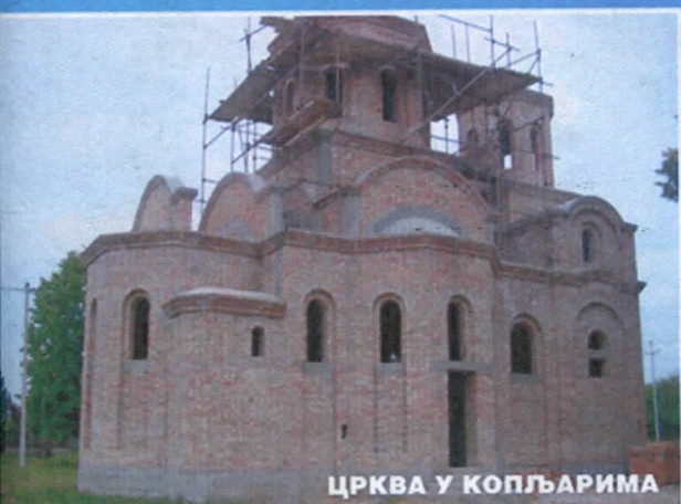
ЦРКВА У КОПЉАРИМА