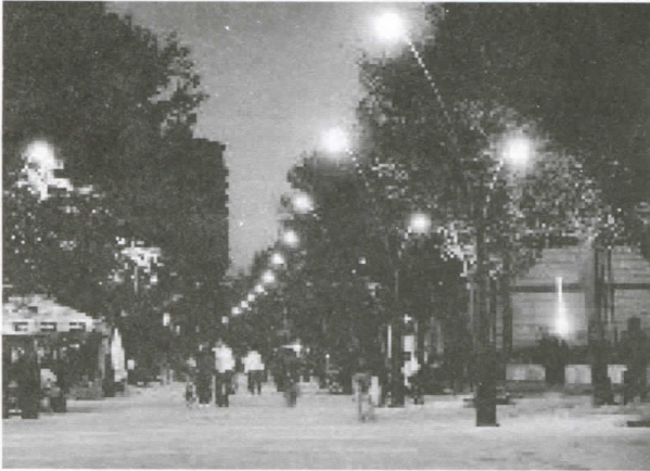
Ово је Шабац