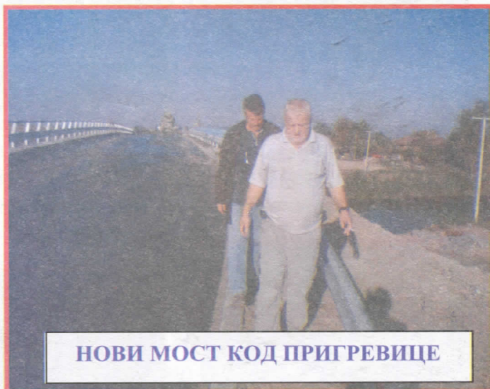
НОВИ МОСТ КОД ПРИГРЕВИЦЕ

Као велико признање доживљавамо и чињеницу да велики број предузетника санашег подручја сада већ отворено подржава програм и иницијативе Српских Радикала , а такође у свим радикалским срединама више него очигледно је интересовање страних инвеститора и њихова жеља за улагањем капитала управо из разлога што нас доживљавају, како сами кажу, као једине представнике власти у Србији које не интересује лични ћар и узимање сопственог процента, већ као људе који просто желе њиховим капиталом унапредити сопствену средину, створити могућност запошљавања што већег броја незапослених грађана.