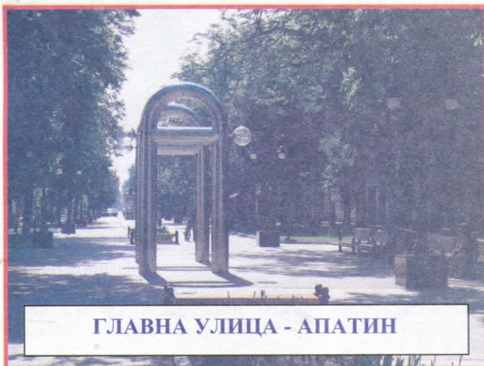
ГЛАВНА УЛИЦА - АПАТИН

„ МИ СЕ НЕ ХВАЛИМО , МИ ВАС САМО ПОДСЕЋАМО “