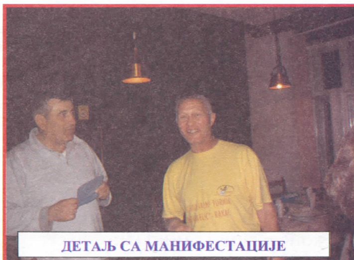
ДЕТАЉ СА МАНИФЕСТАЦИЈЕ

Смисао туризма у нашем окружењу фактички добија на значају у свом пуном интензитету тек у последње две године, што се може видети и по градњи