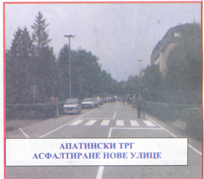
АПАТИНСКИ ТРГ АСФАЛТИРАНЕ НОВЕ УЛИЦЕ