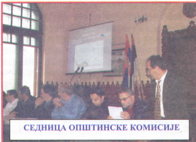
СЕДНИЦА ОПШТИНСКЕ КОМИСИЈЕ

Овакав приступ као и читав низ ствари које нисмо успели да поменемо свакако је решење за бољитак и унапређење и других животних средина којима свакако можемо служити за пример и као што то приличи Српским Радикалима нају се у помоћи у сваком смислу.