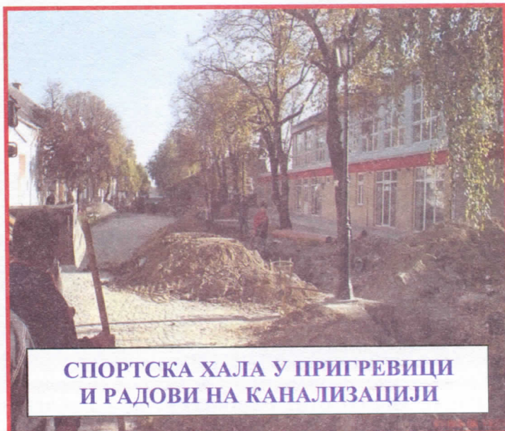
СПОРТСКА ХАЛА У ПРИГРЕВИЦИ И РАДОВИ НА КАНАЛИЗАЦИЈИ

Читав низ година , укупно 16 требало је некад најпросперитетнијем селу у овом делу Србије , Пригревици , да дочека како би власт преузели људи који су у стању да дугогодишњи немар и небригу покрену са мртве тачке и већ увелико забринутим пригревчанима пробуде наду да Пригревица није заувек пала у незнађе. Неки нису хтели да улажу у Пригревицу зато што су били готово сигурни да ту имају сигурно бирачко тело , други нису хтели улагати у Пригревицу управо зато што нису имали подршку пригревачких гласача. И тако све док пригревчани нису одлучили да непрекидно уназад неколико година безрезервно дају подршку Српској