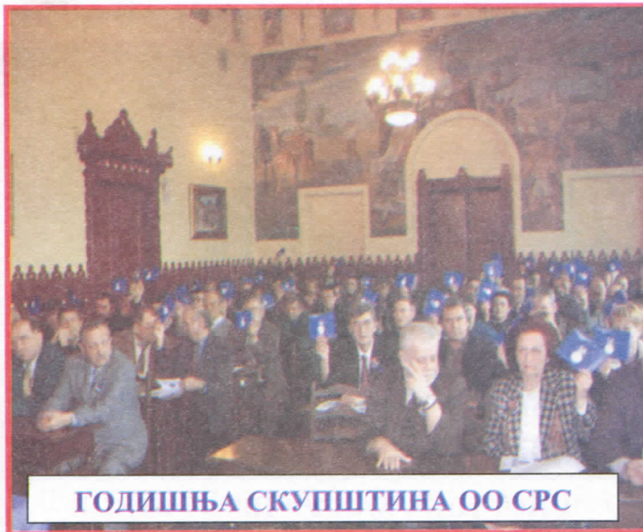
ГОДИШЊА СКУПШТИНА ОО СРС