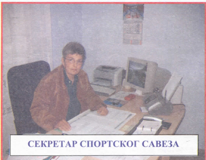
СЕКРЕТАР СПОРТСКОГ САВЕЗА

Дворишни део поседује спортске терене . Пуштене су у рад две савремене спортске хале , у Пригревици и Сонти и Дом спортова на води за потребе спортских риболоваца. Широм града постављени су голови и кошеви , а исти третман у наредном периоду биће и према сеоским срединама. У току је израда пројекта атлетског стадиона који би требао да се гради у Апатину и много нових планова .