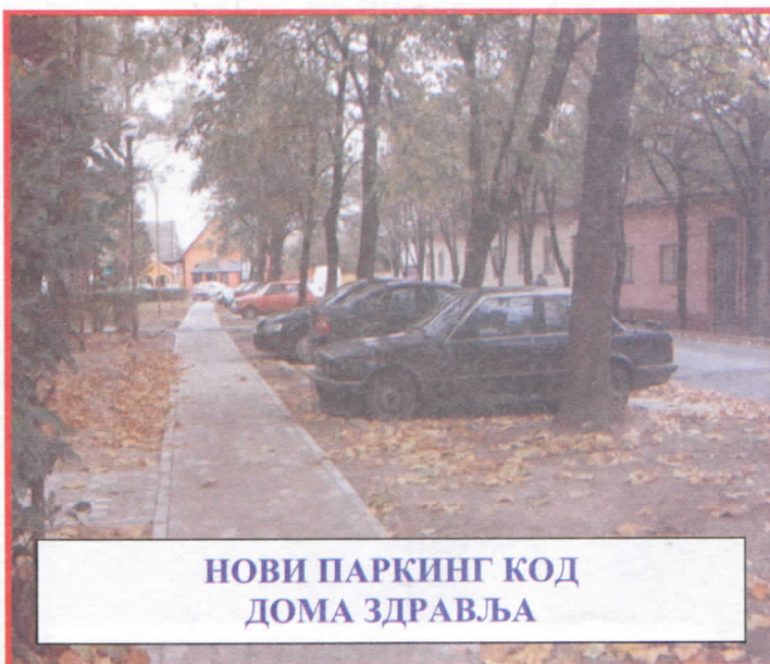
НОВИ ПАРКИНГ КОД ДОМА ЗДРАВЉА