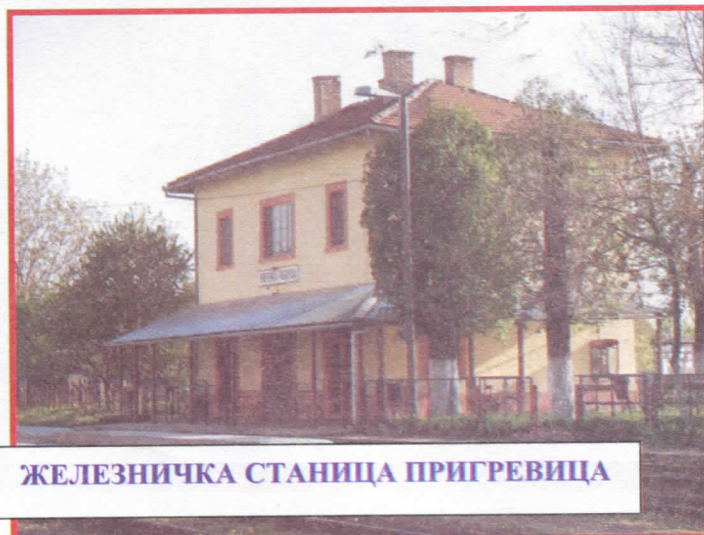
ЖЕЛЕЗНИЧКА СТАНИЦА ПРИГРЕВИЦА

рушећи препреку по препреку и не осврћући се на отпоре ни измишљотине појединих ,, доказаних ,, сеоских структура , већ указано им поверење враћају бројним пројектима и инвестицијама. Снага и одлучност коју смо показали у досадашњем периоду свакако утиче на наше окружење, како ово уже тако и гледано у ширем смислу, те је интересовање за улагањем у саму Пригревицу постало предмет размишљања многих предузетника и људи који желе у неком наредном периоду свој капитал инвестирати управо у Пригревицу. Доста је наших људи из расејања који показују све већи интерес за своје село и који почињу да улажу у објекте у Пригревици . Време је најбољи судија и управо ће оно показати да ће тактичност и мудрост и како смо већ рекли , политика која даје резултат, бити оно што ће конкретизовати све досадашње напоре , и управо је то најбољи модус повратка Пригревице на старе стазе некадашње доминације на свим пољима.