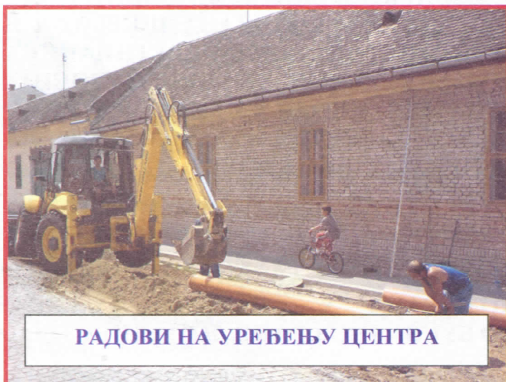
РАДОВИ НА УРЕЂЕЊУ ЦЕНТРА