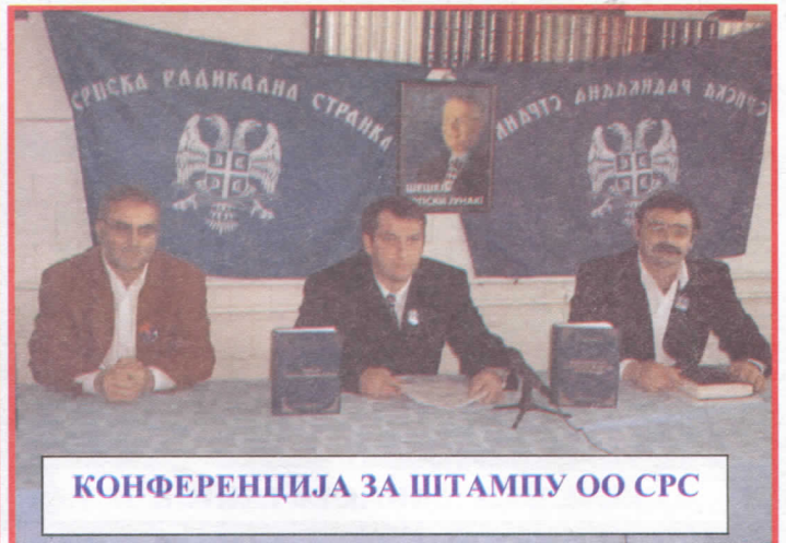
КОНФЕРЕНЦИЈА ЗА ШТАМПУ ОО СРС