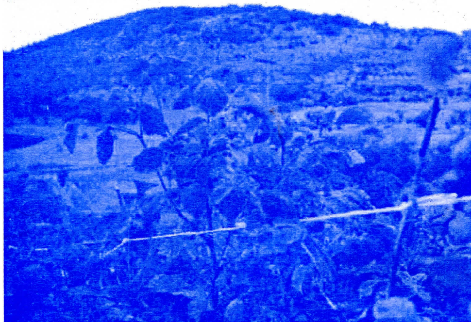
Угрожена врста: Малина заштитни знак Ариља

*Хладан туш* стигао је од директора Јавног предузећа Регионална санитарна депонија *Дубоко* из Ужица. Гостујући на једној од седница локалног парламента, својим објашњењем начина рада будуће регионалне депоније, он је распршио све наше илузије да смо про-