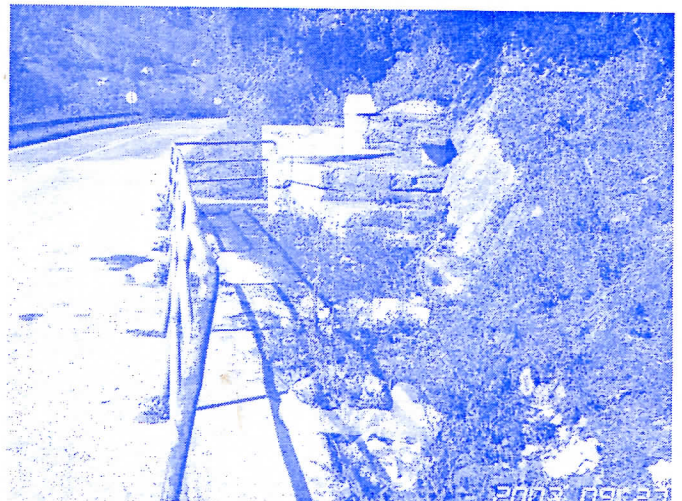
Смрче ѿоред дејоније су се осушиле, а вода није безбедна за ујошребу