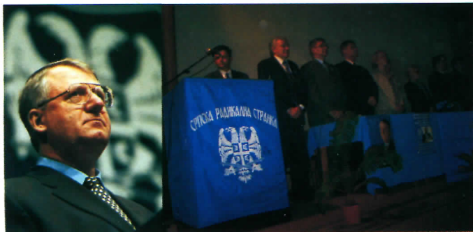
А ВОДЕ НЕМА

У Тополи већ други пут у последњих месец дана на снази су мере „планског“ искључења воде. Грађани Тополе немају воду од 19ч увече до 07ч ујутро док становници околних сеоских подручја ни ноћу ни дању. За њих је вода мисаона именица.