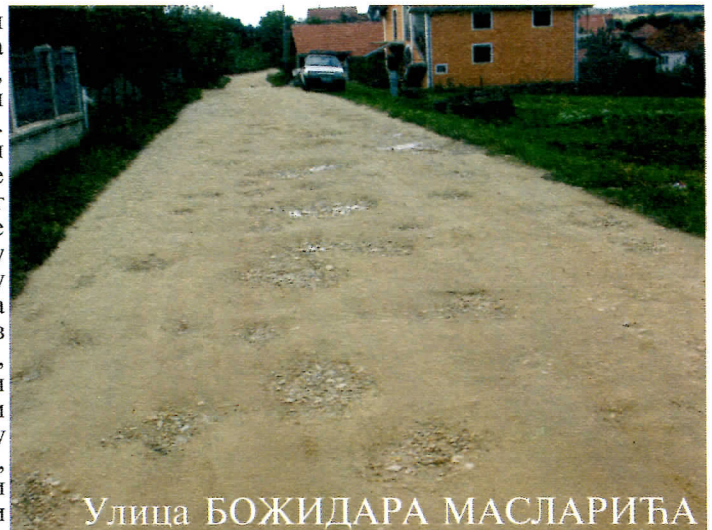
Улица БОЖИДАРА МАСЛАРИЋА

Житељи ове месне заједнице, иако удаљени само 3-4 километара од строгог центра града, живе, на основу многих критеријума, испод свих цивилизацијских стандарда. Проблеми са којима се становници улице Божидара Масларића, улице Цељске, Љубице Ивошевић, Липарске, Ораховачке, Младеновачке, Тозе Марковића, Повленске, Солинске, Млавске, Наде Димић, Града