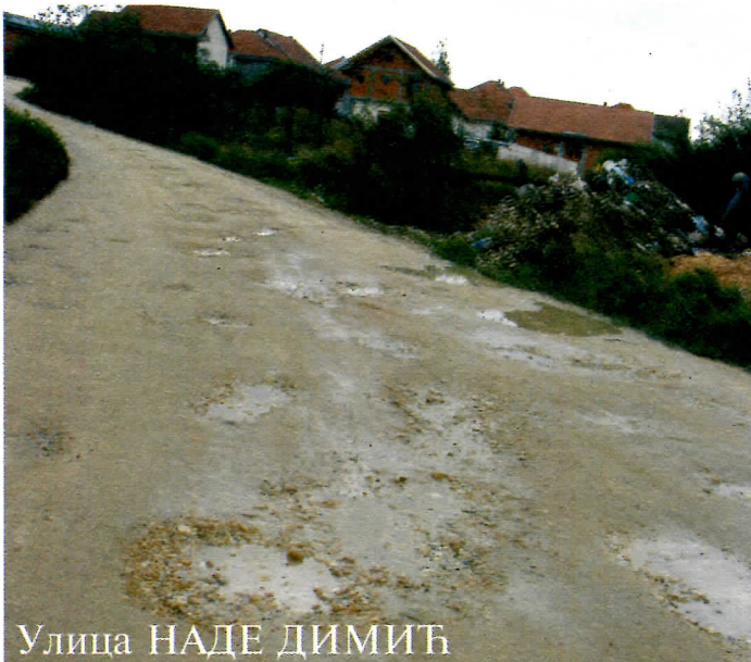
Улица НАДЕ ДИМИЋ