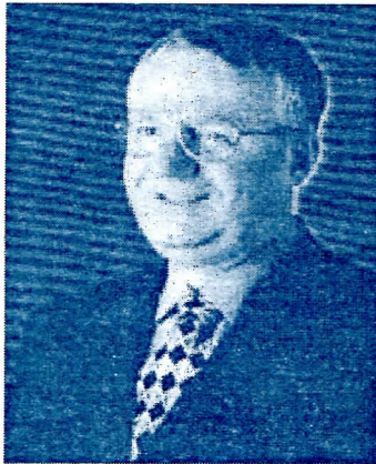
Председник Српске радикалне странке Проф. др Војислав Шешелъ

СОКОБАЊА, СЕПТЕМБАР 2007. ГОДИНЕ ГОДИНА XVIII, БРОЈ 2881