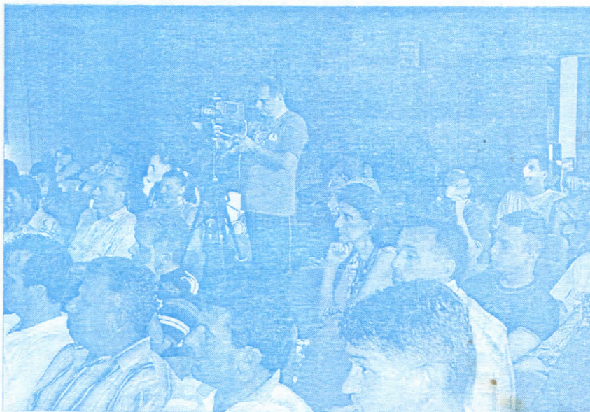
Препуна сала Дома културе у Пријеполу