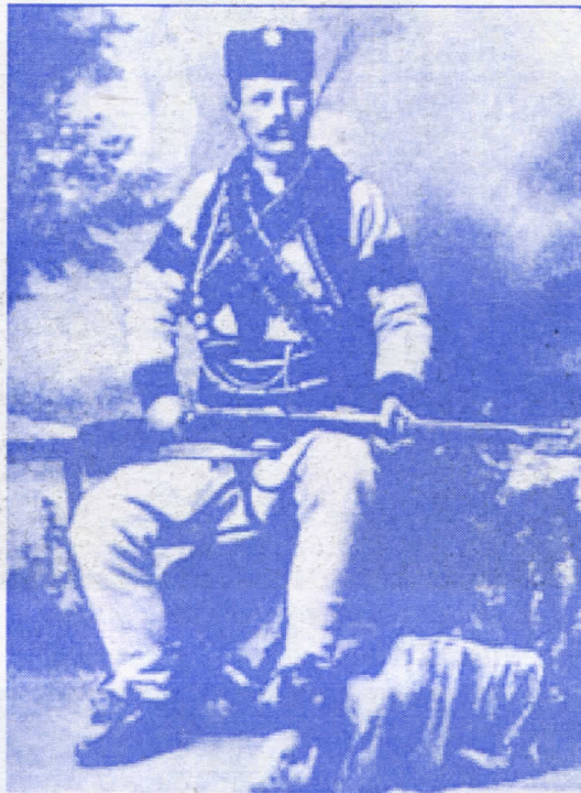
Леџендарни Велешки војвода Јован Бабунски

"Пуштај ма, пуштај Јоване, Чета ће да ми изгоре." Српска ми труба трубаше, Дреново село гореше.