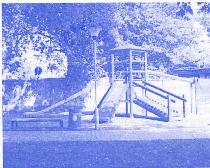
Уређен дечији парк у Руми