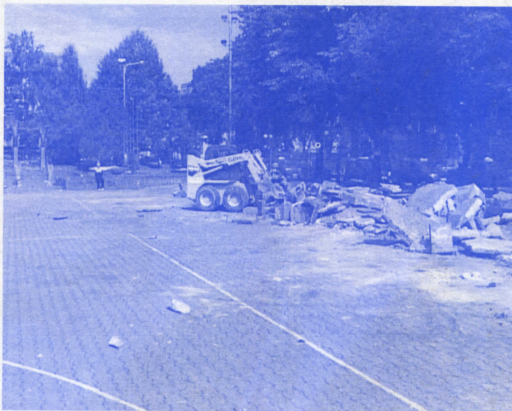
Радови на уређењу градског трга

Огромно поверење добијено на парламентарним изборима, српски радикали, који су осовина локалне самоуправе у Руми, у највећој мери су и оправдали. У јануару 2007. године завршена је једна од најкрупнијих инвестиција у нашој општини: изградња црпне станице у Никинцима, једином селу општине Рума које није имало свој бунар. Црпна станица је стављена у функцију 15. јануара 2007. године, на радост житеља овог лепог села, у коме, поред Срба, живе и припадници хрватске и мађарске националне мањине. Вредност радова на црпној станици у Никинцима износила је око 10 милиона динара, од чега је највећи део – више од 8 милиона динара – обезбеђен у буџету општине Рума. Поред завршетка црпне станице у Никинцима, ЈП «Водовод» остварило је у претходном периоду још један значајан успех: у јулу ове године пуштен је у погон и новоизграђени бунар на путу од Руме према Малим Радинцима (тзв. малорадиначки шпиц), што је омогућило да грађани Руме и у току многобројних жарких дана овога лета имају довољно квалитетне пијаће воде.