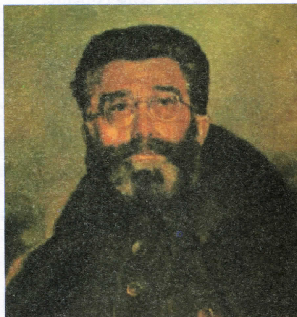
Генерал Дража Михаиловић - вођа Трећеј српској усјанка

Измењена, новија верзија песме Сиремите се, сиремите четници од 1994. године представља и свечану песму (химну) Српске радикалне странке. Данас нема ниједног не само српског радикала, него српског родољуба уопште коме срце брже не закуца на прве тактове ове песме, која је доказ несаломивог, борбеног и слободарског српског духа.