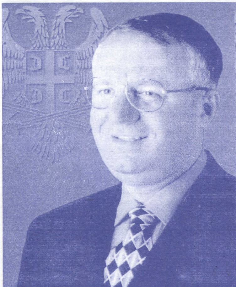
Проф. Др Војислав Шешељ Председник Српске радикалне странке

ДОЉЕВАЦ, СЕПТЕМБАР 2007. ГОДИНЕ ГОДИНА XVIII БРОЈ 2848