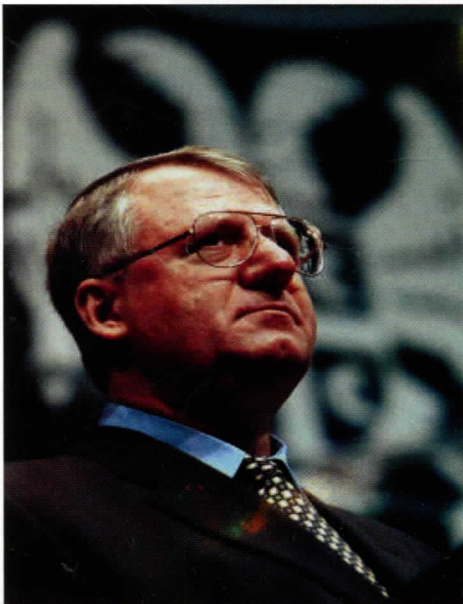
Др Војислав Шешел Председник Српске радикалне странке

Српска радикална странка освојила 15.262 гласова на нивоу општине Гроцка што је више него ДС, ДСС и СПС заједно, које су освојиле 14.565 гласова, од изашлих