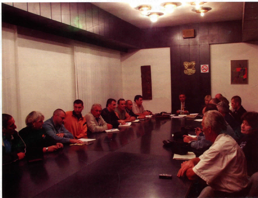
Седница ОО СРС Гроцка

Ево имамо сада типичан пример преваре: Износе слику једног Бус стајалишта од плексигласа у вредности од 150 евра. Ако су само то урадили за две године, Хвала им,