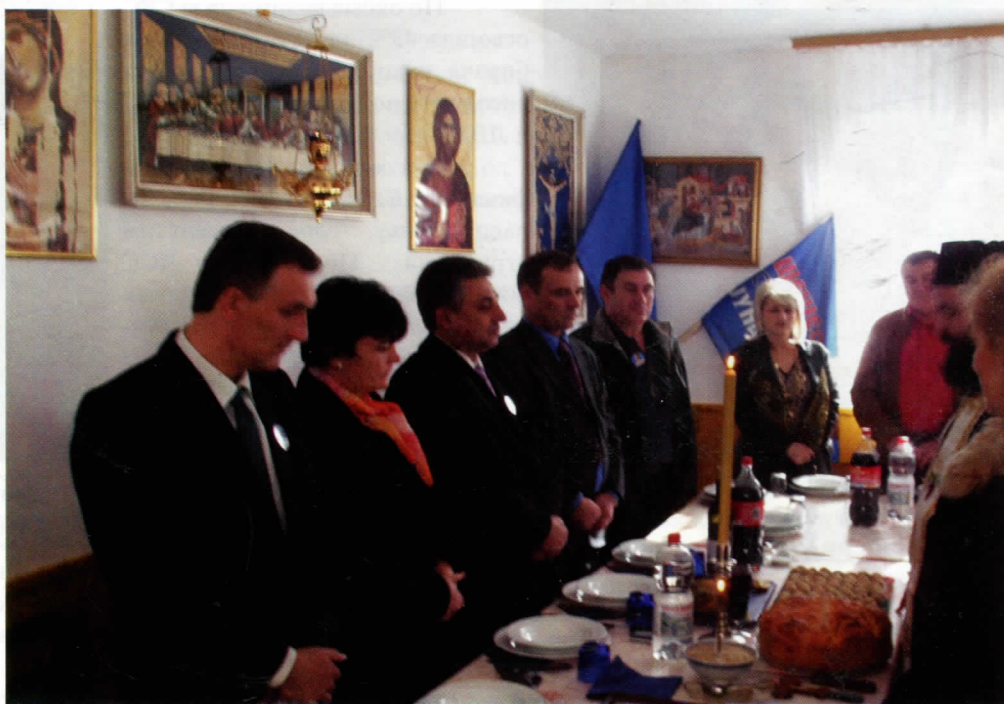
Обележавање славе Српске радикалне странке у манастирском Дому Раиновац -Бегалица-

Домаћин је ове године био Месни одбор Лештане, а