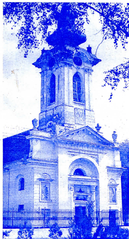
Српска Православна Црква

Дугогодишњи проблем у селу око трафо станице и слабог напона решили смо издвајањем 354,000,00 динара од стране Општине да са електро дистрибуцијом поставимо нову трафо станицу. Радови нису ЈОШ почели јер Електро привреда „тренутно нема средстава“ а Општина је свој део обавезе већ испунила ( личи ли ово да ће неко за изборе напрасно донети трафо у Параге ).