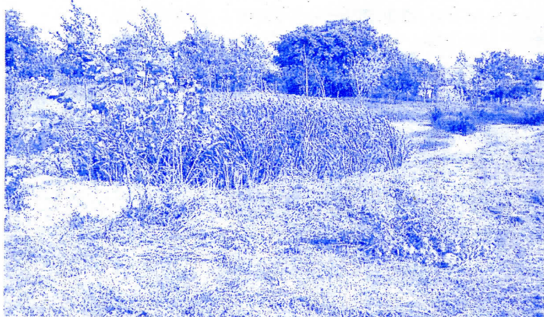
коров чисте Радикали

Општинска екипа за кошење зелених површина у Парагама је косила и оно што није уређивано годинама тако да се даљим уређивањем дође у могућност да се лакше одржавају зелене површине и на њима поставе реквизити за игру најмлађих. О спортском рукометном терену смо већ говорили али треба поновити да ће радикали учинити све да он буде обележен, ограђен и у склопу реконструкције јавне расвете (која у Парагама подразумева 40% нових сијаличних места) и осветљен тако да буде у функцији и у вечерњим сатима и место окупљања омладине.