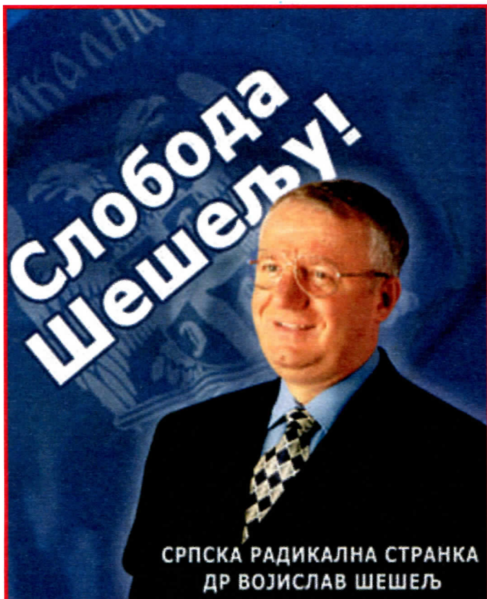
СРПСКА РАДИКАЛНА СТРАНКА ДР ВОЈИСЛАВ ШЕШЕЉ

БИЈЕЉИНА, СЕПТЕМБАР 2006. ГОДИНЕ ГОДИНА XVII, БРОЈ 2724