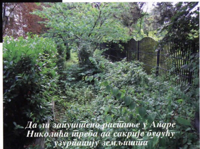
Да ли заштитено растиње у Андри Николића треба да сакрије будућу узурпацију земљишта

У општинској инспекцији пре две године станари су оба-