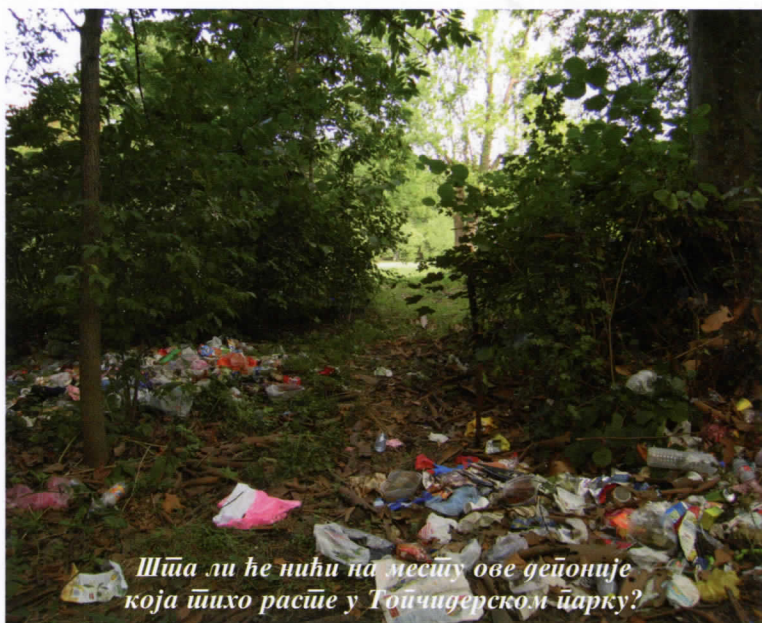
Шта ли ће нићи на месту ове депоније која њихо расће у Топчидерском парку?

бама комунално-грађевинску инспекцију: хаос се шири улицама и парковима општине а нормалан свет хвата се за главу.