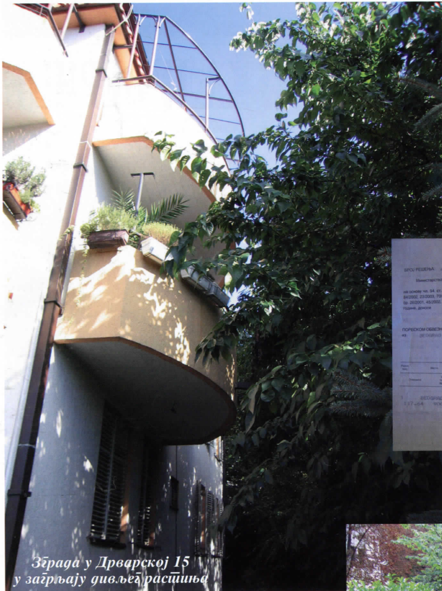
Зграда у Дрварској 15 у закрљају дивљега растиња

Међутим, општинска инспекција проследила је решавање овог захтева градској комисији. Та је комисија наложила општинској инспекцији да реши питање скра-