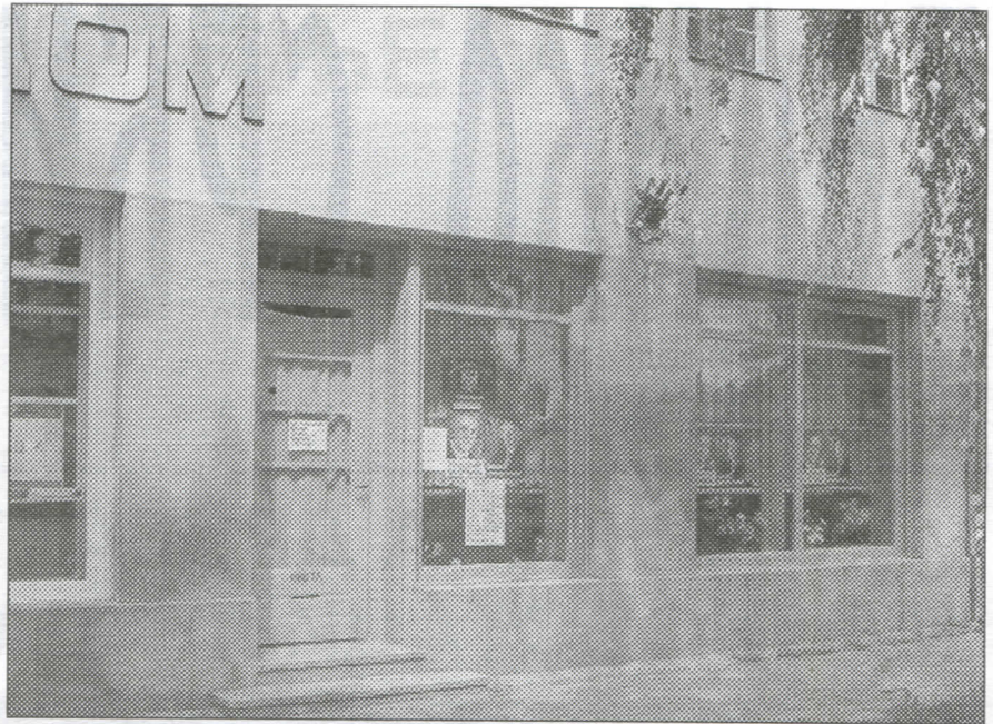
Канцеларија СРС у Мољу