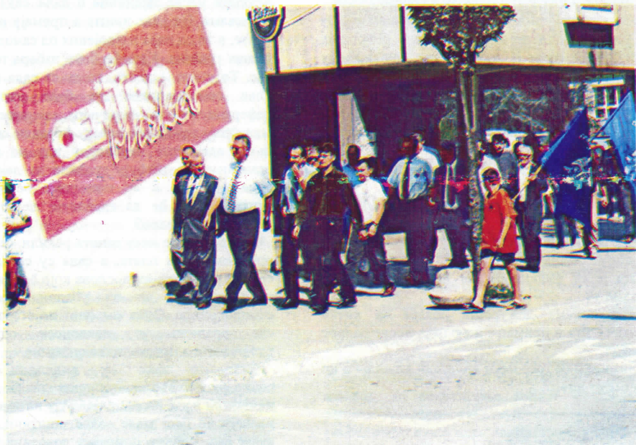
Војислав Шешељ у посети Мајданпеку 07.09.2002. године

Тако је готово не могуће створити сопствени играчки кадар што је веома важно за квалитетно функционисање клуба. Управа и тренери раде у највећој мери на omasовљењу рукомета да би клуб могао да ради у будућности.