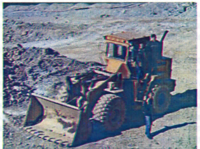
Застареле и дотрајале машине у РТБ-у

Посебна је прича однос власти према рудним богатствима и не брига за санацију постојећег стања, даљи развој и запошљавање младих, стручних кадрова који данас живе од пензија својих родитеља.