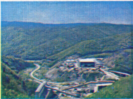
Погони рудника Бакра Мајданпек

Најдрња пословица "Да Бог да имао, па немао" укоренила се у наш народ и свакодневницу. Присутна је у нашим животима у мањој или већој мери. У неким срединама је мање уочљива, јер су оне деценијама биле на ивици беде, на коју се људи силном навикну.