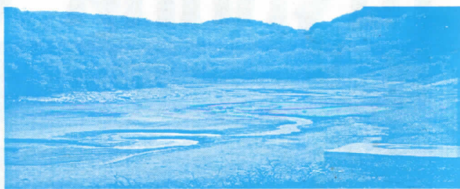
Одавде је Мајданпек пио воду-исушено језеро "Велики Затон"

Где ће се наша деца купати овог лета? На мору сигурно не. Можда у спортској хали, ако се за то створе услови.