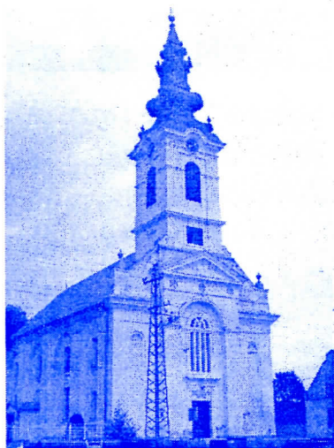
Slovačka Evangelistička crkva