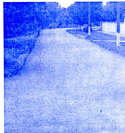
ulica Jovana Popovića

Na rok 2005 si budeme pamätať ako na rok politicky nestabilný pre svojvôľu republikových orgánov. Srbskí radikáli ukázali, že sú kľúčovým faktorom lokálnej samosprávy aj po zopakovaných lokálnych voľbách a že aj popri všetkých objektívnych, ale aj nanútených obmedzeniach zostanú iniciátormi všetkých aktivít dôležitých pre rozvoj obce.