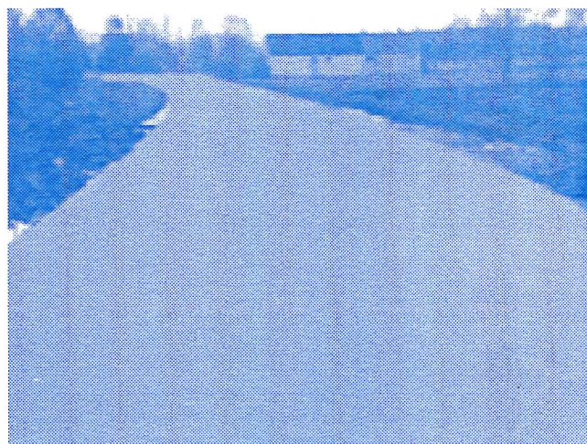
Путни правац Богатић - Глушци пре и после