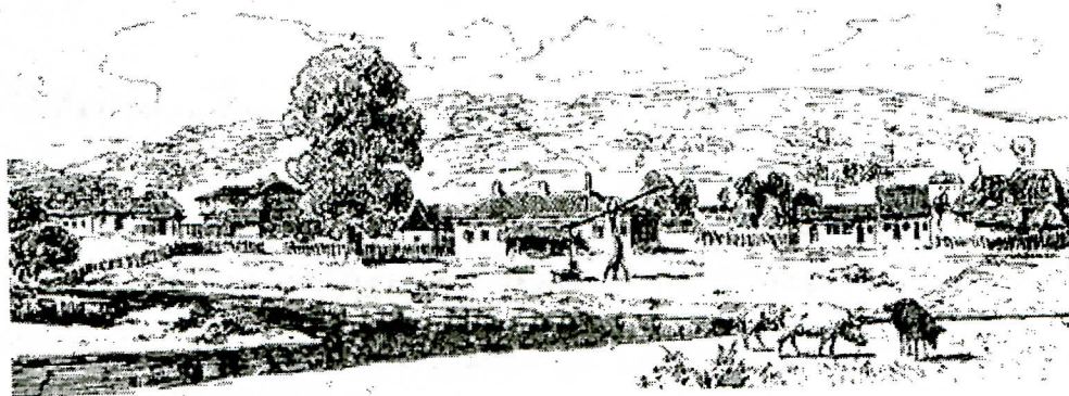
ЛЕБАНЕ почетком XIX века

У згради Скупштине општине Лебане запошљених највише после 5. Октобра, а тај број се стално увећава. Оне који раде по уговору такође финансира општински буџет јер се за њихово пензионо инвалидско осигурање издваја општински новац.