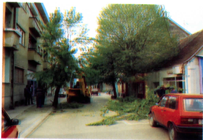
Зеленило ђлаћа свој данак