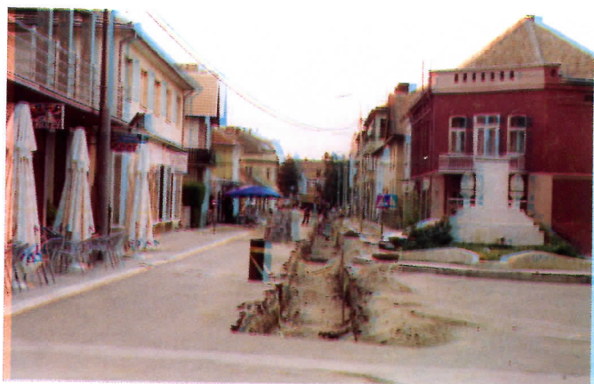
Море "Марко" не ори друмове, море Лайовци не газиие орање.