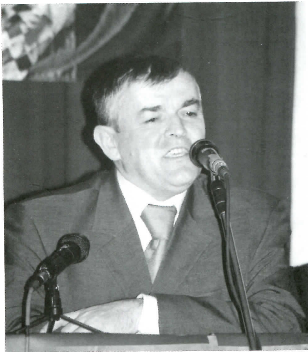
Генерал Божидар Делић

Вече 6. априла 2006. године у Лапову, будило је наговештај нове, лепше будућности коју може пружити, то је већ свима јасно, Српска Радикална странка. Сала Дома културе била је мала да те вечери прими све оне који су дошли на промоцију књиге проф. др Војислава Шешеља "Сведок одбране Слободана Милошевића у Хашком процесу" и већином отворено, а тек у траговима стидљиво и прикривено даје уједно и подршку Српској радикалној странци.