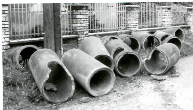
"Нове" цеви за кишну канализацију